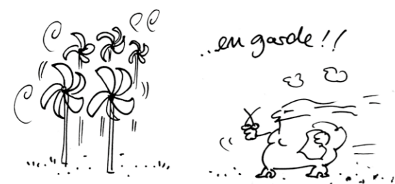
Donna Quichote im pädagogischen Windpark..