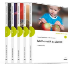
Set 1: Die Natur und die Dinge

23 Filme aus 23 Jahren von Donata Elschenbroich und Otto Schweitzer