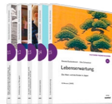
Set 3: Kulturen früher Bildung