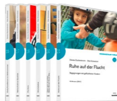
Set 4: Resonanzraum Familie

Die Filme können einzeln (für 10 bis 24,90 Euro), im Set (5 bis 6 Filme für 100 Euro) oder als Gesamtpaket (23 Filme für 350 Euro) bestellt werden.