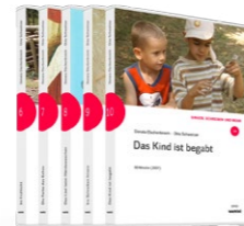
Set 2: Singen, Schreiben und mehr